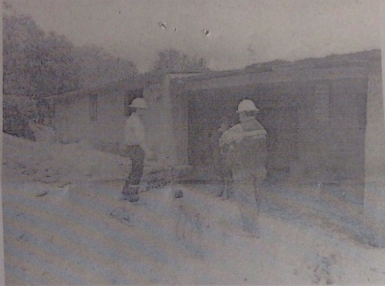
Fotografía No 1 Visita a la Finca Buenos Aires Chinibal

En el punto tercero del derecho de petición se describe "que los daños causados consisten en la que la casa quedó en un nivel inferior a la vía, es decir que las aguas lluvias penetran a bien inmueble al momento de cada aguacero", por lo anterior en la fotografía No 2 se detalla que las aguas de escorrentía de la vía se encuentran totalmente canalizadas a través de cunetas en ambos costados de la vía.