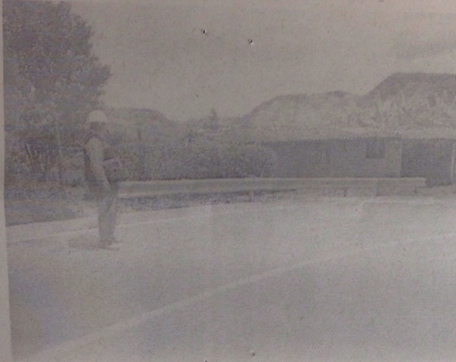
Fotografía No 3. Vivienda Finca Buenos Aires Chinibal. Defensa metálica