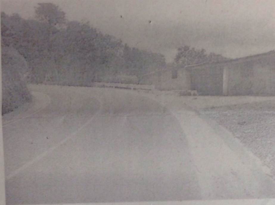
Fotografía No 4. Vivienda Finca Buenos Aires Chinibal. Defensa metálica

De esta manera, la Secretaria de Infraestructura Departamental resuelve su petición, manifestando la absoluta disposición para dar respuesta a las inquietudes que se desaten y que tengan competencia en este Despacho, estando atentos a próximos requerimientos.