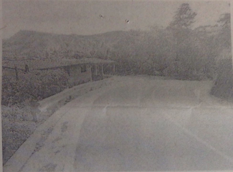
Fotografía No 2. Vivienda Finca Buenos Aires Chinibal, Cunetas ambos costados

En el punto cuarto del derecho de petición se refiere a "El daño más grave que está presentando que la empresa contratista dejó un trayecto de la obra sin ampliar ubicado en el kilómetro 6 con 200 metros de Gambita a Vado Real, quedando en alto riesgo mi bien inmueble casa habitación a la deriva de accidentes de todo por la negligencia de la citada empresa de no ampliar y despejar dicho lugar", la vivienda se localiza dentro del derecho de vía de la carretera, por lo cual se encuentra en probable riesgo de accidentalidad, en el desarrollo del proyecto se realizó la instalación de una defensa metálica para proteger la casa de un probable siniestro la cual se detalla en la fotografía No 3 y 4.