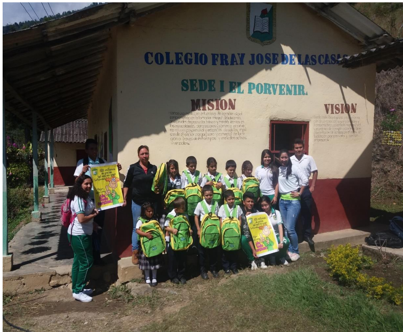
Gestión realizada ante la Directora del Hospital E.S.E para la consecución de Kit Escolares.