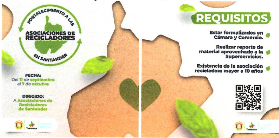
Figura 1. Pauta Publicitaria